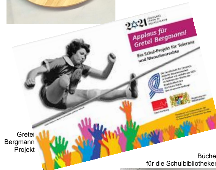
Gretel Bergmann Projekt